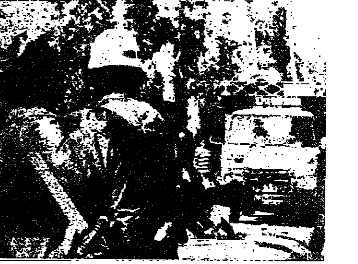
القوات الاسرائيلية تستوقف مواطنين لبنانيين